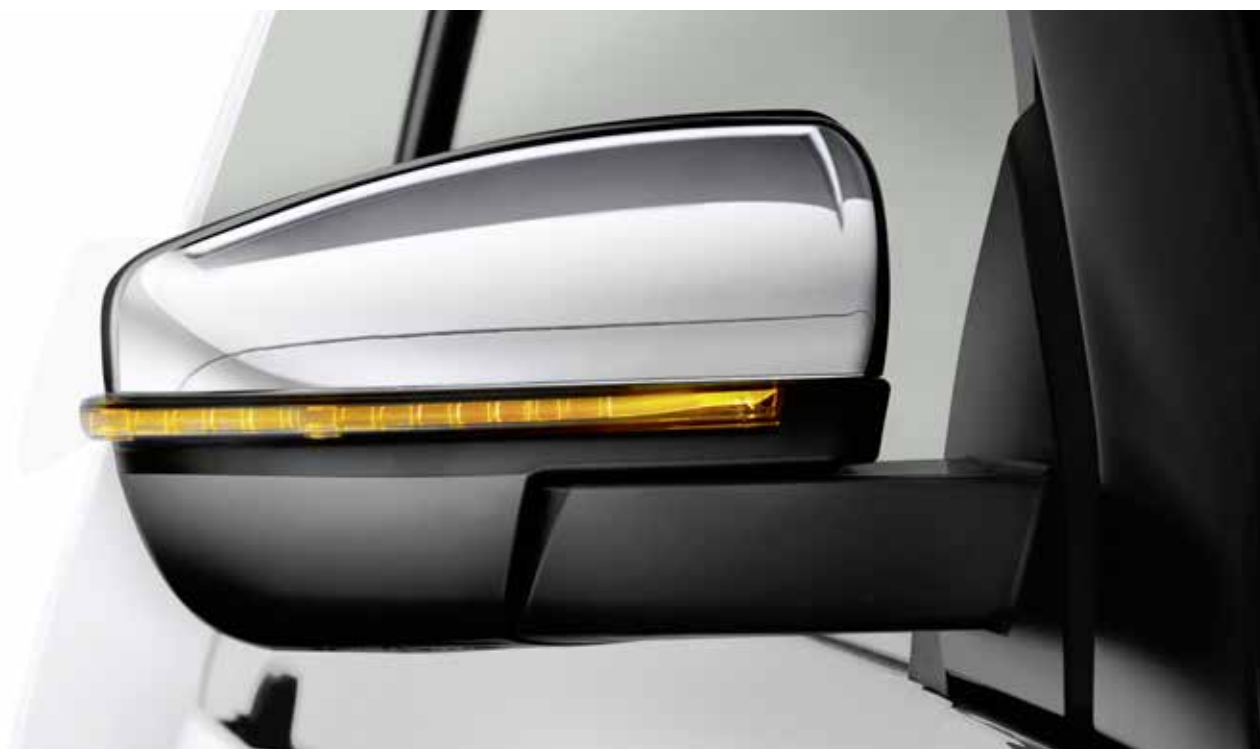
Aussenspiegel mit LED-Blinker, Serie ab Premium