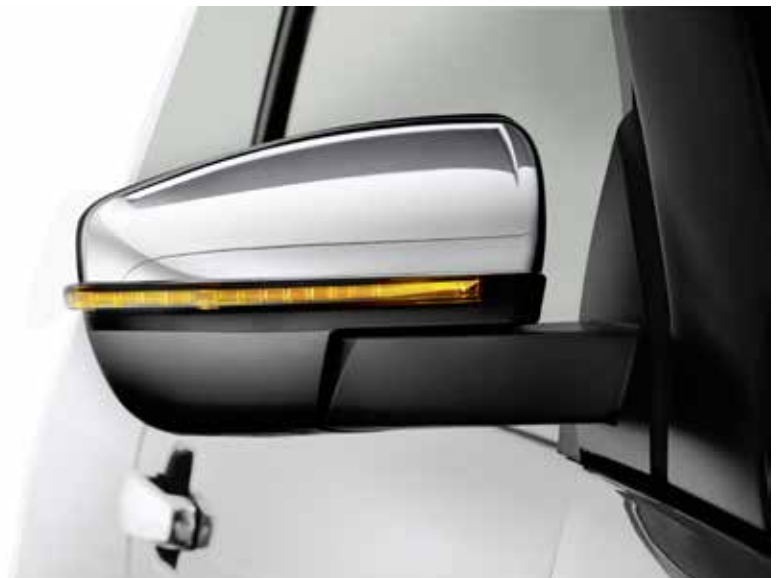
Aussenspiegel mit LED-Blinker, Serie ab Premium