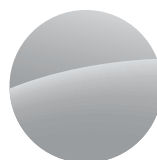
SILBER - METALLIC