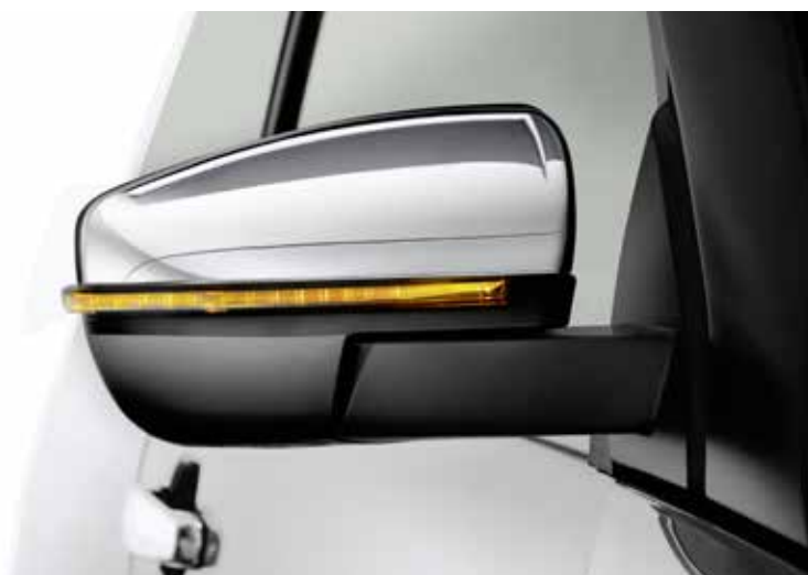
Aussenspiegel mit LED-Blinker, Serie ab Premium